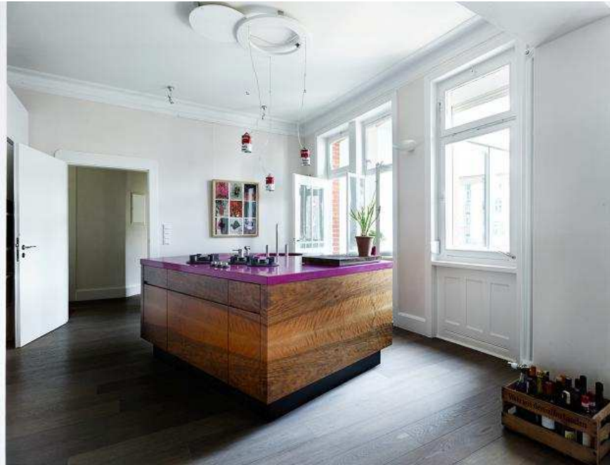
Die Kücheninsel K11 in französischem Nussbaum und Magenta-Silestone Platte.

Showroom Livinghouse: Unter dem Birkenkopf 16 70197 Stuttgart