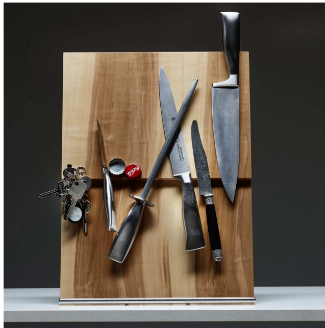
Der KB1 – links in geheimnisvoller Mooreiche und rechts seine Anziehungskraft unter Beweis stellend.

Die Kücheninsel KI1 ist ein weiteres Produkt der Sarah Maier collection, welches von der Jury in Köln ausgezeichnet wurde. Mit dem Label „Selection“ hob die Jury die herausragende Designleistung und die neuartige Kombination von Materialien hervor. Die Küche ist asymmetrisch fünfeckig, die magentafarbene Kunststeinarbeitsplatte ist dreidimensional kantenlos geschliffen, sodass die Arbeitsfläche von allen Seiten zum Spülbecken hin abfällt. Die Gasfelder sind frei auf der Fläche angeordnet, ein 50 Jahre alter französischer Nussbaum windet sich perfekt um die Block und zeigt, den Kern nach aussen gelegt, seine Eleganz in Verbindung mit der farblich hervorstechenden Arbeitsplatte.